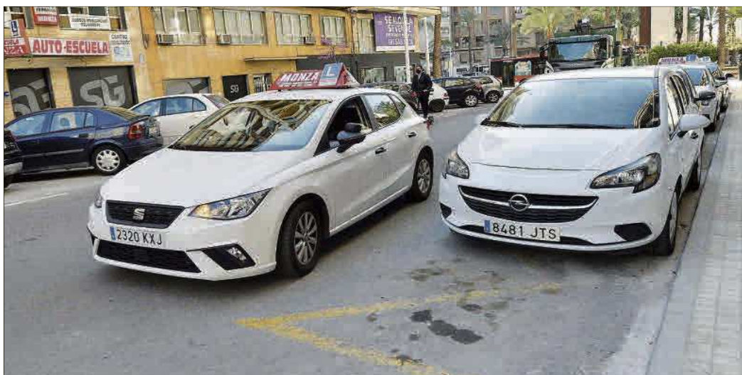
Un vehículo de autoescuela, en una calle de Elche mientras espera para comenzar una práctica con alumnos.