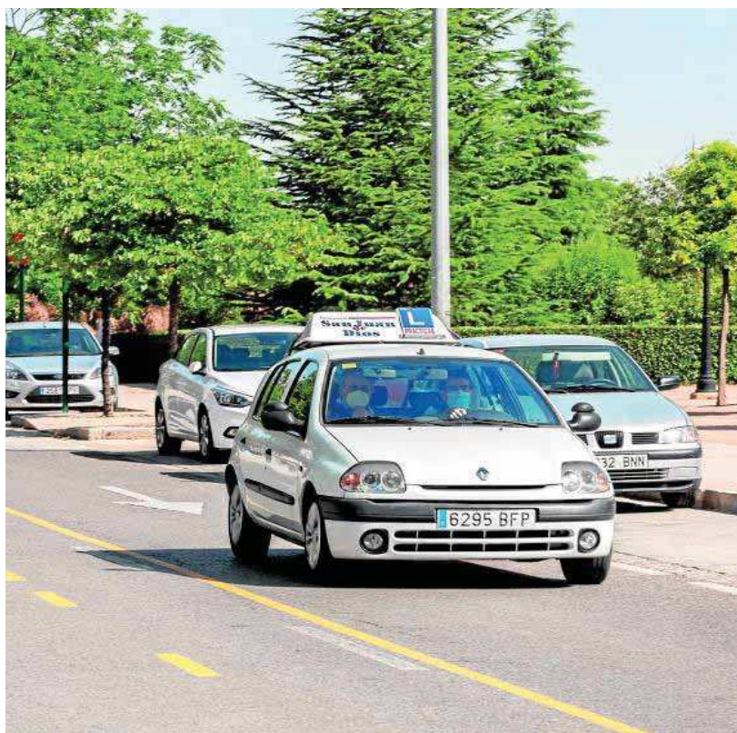
Vehículo de prácticas de una autoescuela, en una imagen de archivo.

El sistema es complejo. Ana Isabel Espinosa, que regenta autoescuelas Élite en Albuñol y Almería, tiene a 150 alumnos en bolsa, y lleva a examen una decena cada dos semanas. Las autoescuelas tienen cada 15 días un tiempo asignado para el examen que varía en función de varios factores. En la asignación de examinadores influyen los aprobados en teórico o destreza de cada autoescuela e incluso los suspensos, factor que penaliza