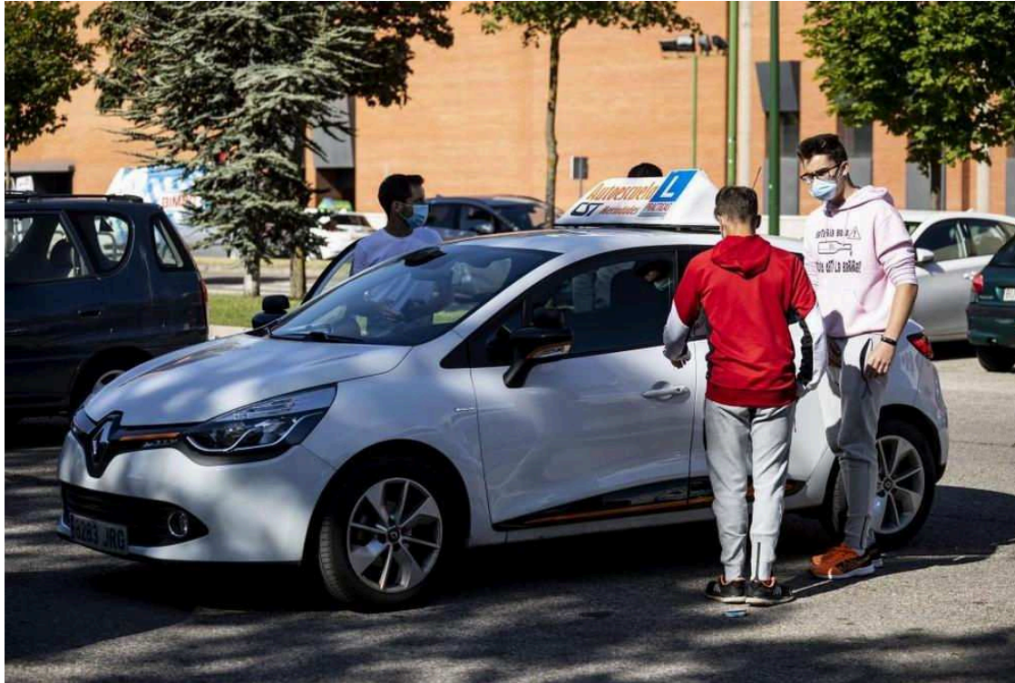
Los exámenes en la ciudad empiezan en el parking de Alcampo.

La Jefatura de Tráfico admite que se precisan más de los cinco que hay actualmente. El sistema ahora da prioridad a los centros con más aprobados