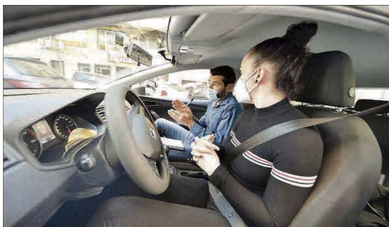
Un profesor y una alumna, en un momento de una clase en Elche.

Los examinadores pueden hacer hasta 12 pruebas por día (si son de la clase B) y la posibilidad de ir a examen depende de ese sis-