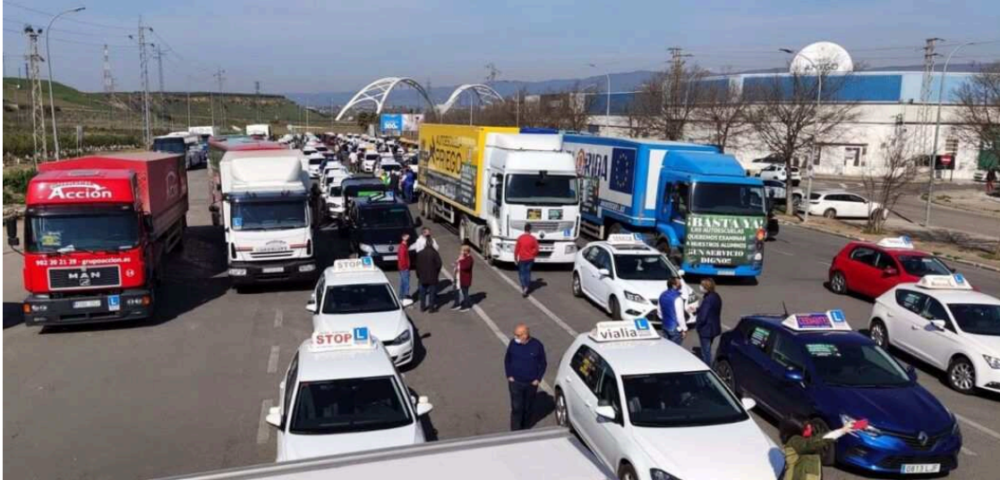
La caravana de vehículos de autoescuela en su recorrido por Córdoba. - APACANDALUCÍA ESPAÑA EUROPA CÓRDOBA ECONOMIA APAC

Una caravana integrada por unos 200 turismos, camiones y autobuses de autoescuelas de toda la provincia de Córdoba ha marchado por la capital cordobesa este jueves, por las principales calles y avenidas y con el Polígono Industrial Amargacena como punto de inicio y fin, para manifestar así su oposición a la implantación del nuevo sistema CAPA para los exámenes.