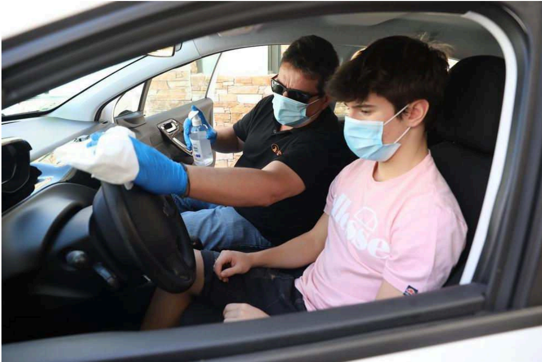
Asociación de Autoescuelas cree que no es momento de exigir

La Asociación Provincial de Autoescuelas de Toledo, ante la convocatoria por parte de algunas de las autoescuelas de una manifestación por las calles de la ciudad el próximo día 19 de marzo, ha señalado no es momento de reivindicar