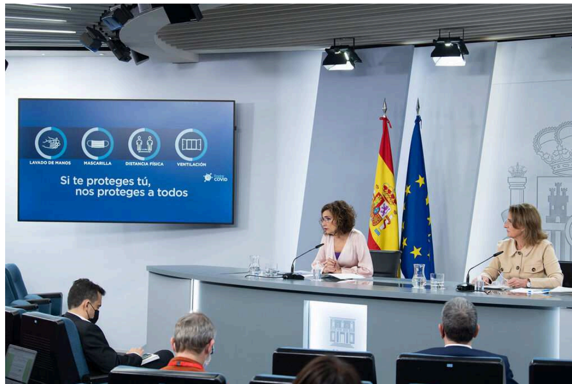
Rueda de prensa posterior al Consejo de Ministros del 16 de marzo

El pasado 10 de noviembre de 2020 se aprobó en el Consejo de Ministros un Proyecto de Ley para la reforma del Real Decreto Legislativo 6/2015, de 30 de octubre; en otras palabras, Ley sobre Tráfico, Circulación de Vehículos a Motor y Seguridad Vial . Pero este solo era el primer paso para su tramitación, como os comentamos previamente .