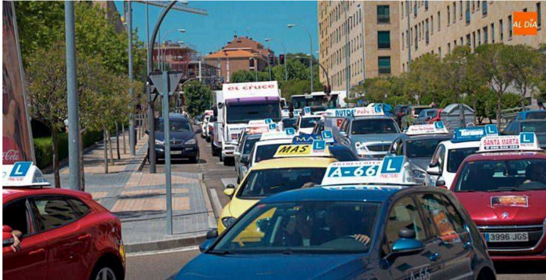
Foto de archivo de una movilización anterior del sector de las autoescuelas en Salamanca

Además, el sector no fue incluido entre los beneficiarios de las nuevas ayudas directas del Gobierno, aunque parece que existe una rectificación que los tendría en cuenta