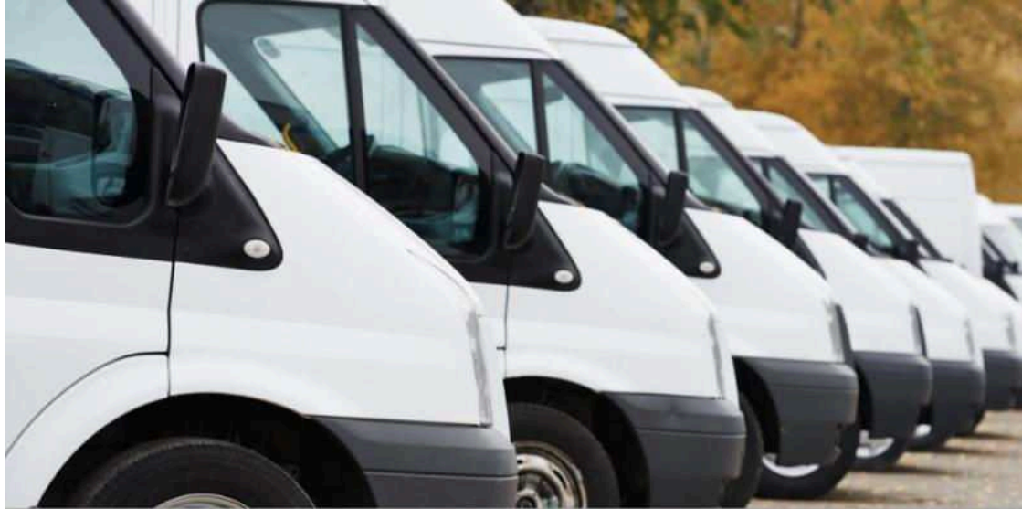
Flota de furgonetas | Foto: Fundación Línea Directa