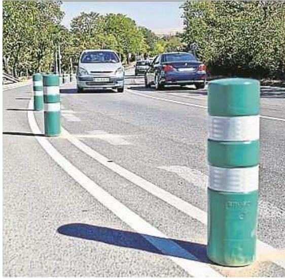
Bolardos y pivotes... hasta cierto punto -