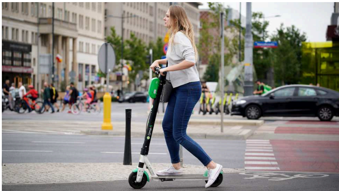
Más regulación a los patinetes: solo por vías a 30 km/h y con mínimo 16 años

Antes de la llegada definitiva de una normativa para toda España ideada por la DGT, los ayuntamientos siguen aclarando el uso de los patinetes eléctricos.