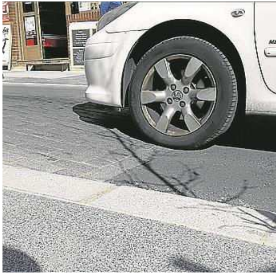
Resaltos: ralentizan y obtaculizan el tráfico -