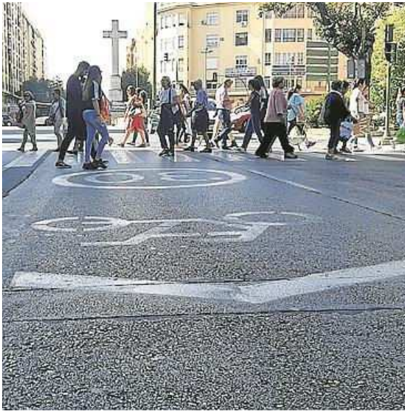
El dibujo de la bici no es correcto -