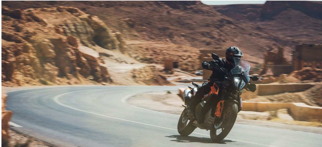
Ktm 269235 790 Adventure Media Launch Morocco 2019

Desde hace mese venimos escuchando rumores que apuntan a que la DGT podría llevar a cabo un plan de formación para motoristas que implicaría un aumento en los puntos del carnet de conducir , una idea que la DGT ya había incluso confirmado y en la que ahora se reafirma, apuntando además que lo puntos adicionales que tendrán los conductores de moto que acudan a uno de estos cursos de conducción y seguridad vial serán más de los 2 o 3 puntos de los que se había hablado inicialmente .