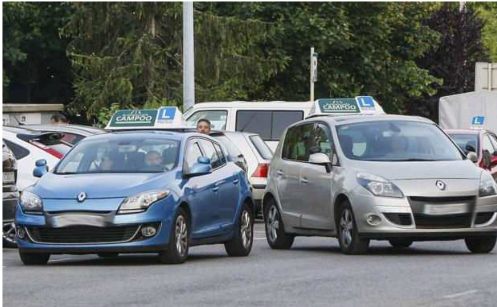
Dos coches de autoescuela.

El pasado 15 de septiembre entró en vigor una instrucción de la Dirección General de Tráfico (DGT) por la que se permite disponer a los vehículos utilizados para la realización del examen práctico de conducir de determinados sistemas avanzados de ayuda a la conducción (ADAS) .