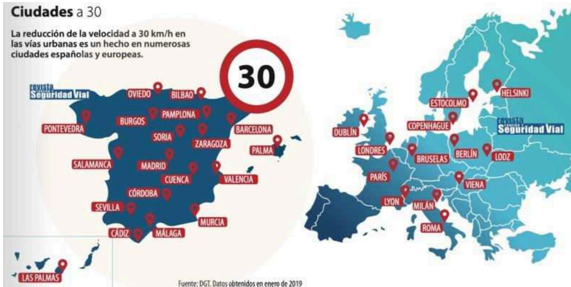
Ciudades españolas y europeas con 30 hm h.