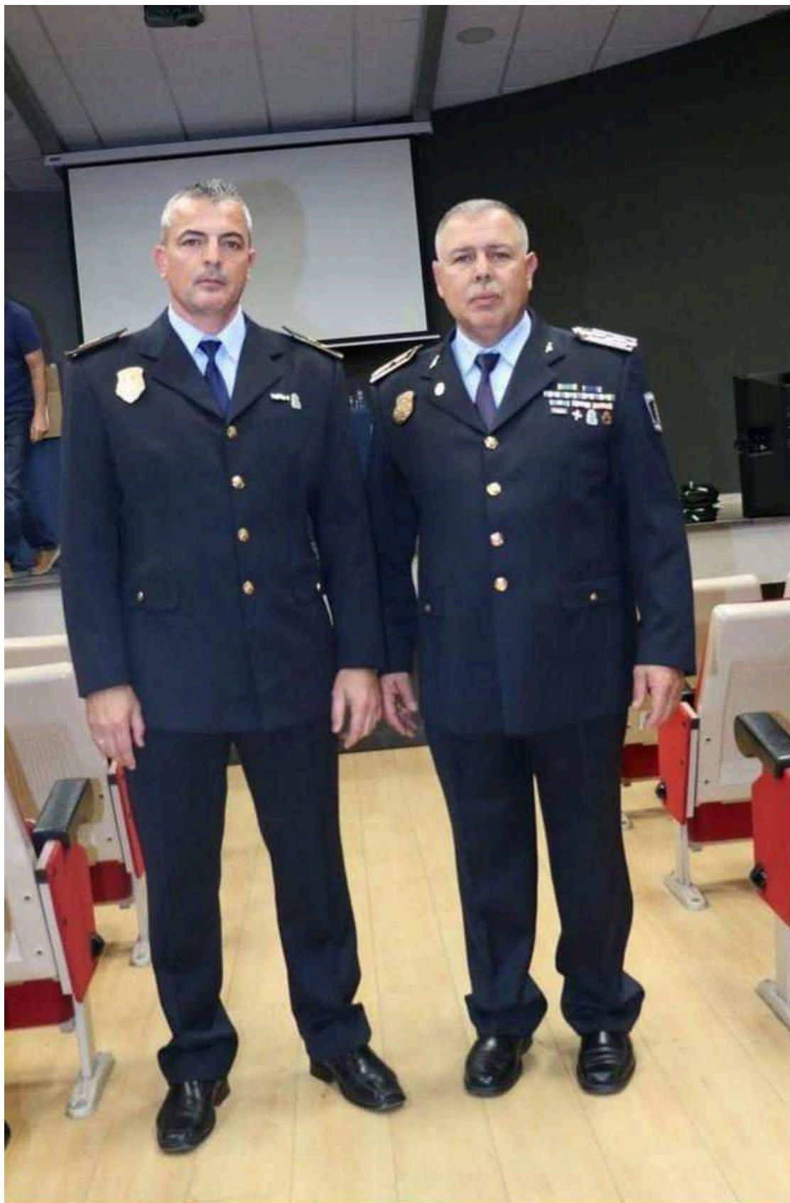
El Alcalde de Puerto del Rosario felicita al inspector y al oficial premiado destacando la trayectoria del Departamento en el ámbito de la Seguridad Vial, especialmente a nivel preventivo.