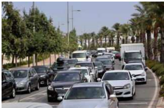
Tráfico intenso en los accesos a Benidorm esta mañana

Los drones de la Dirección General de Tráfico han comenzado hoy a multar a los conductores que infrinjan la normativa de Tráfico y Seguridad Vial con motivo del inicio de la segunda fase de la Operación Salida del verano, que arrancó este miércoles para la que se prevén 2,9 millones de desplazamientos por carretera en la Comunidad Valenciana de los que 1,5 millones circularán por las carreteras de la provincia de Alicante hasta las cero horas del próximo lunes.