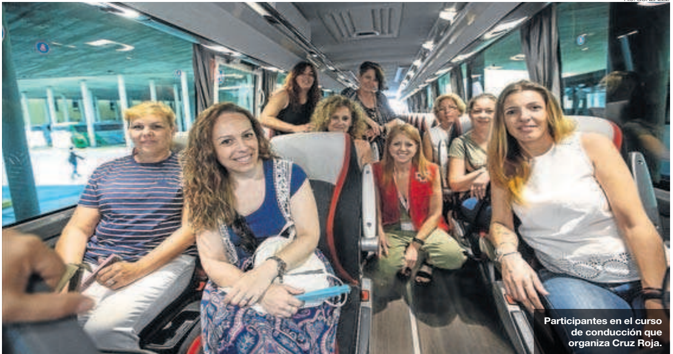
Participantes en el curso de conducción que organiza Cruz Roja.