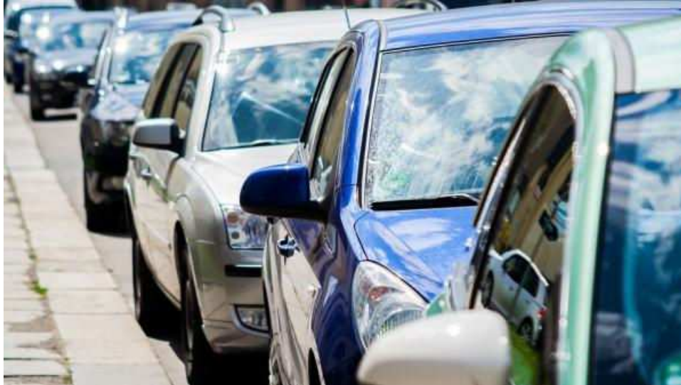
Los vehículos no deben pegarse a los que circulan delante con el fin de evitar colisiones.