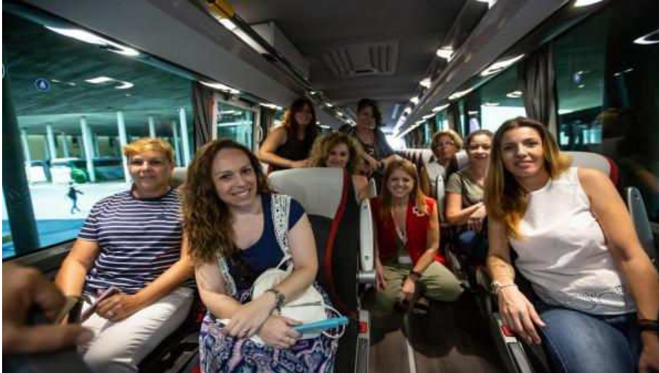
Curso de Cruz Roja para la contratación de mujeres como conductoras de autobús