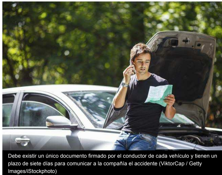
Debe existir un único documento firmado por el conductor de cada vehículo y tienen un plazo de siete días para comunicar a la compañía el accidente

El apartado ' Circunstancias ' establece una serie situaciones que los conductores deben marcar si creen que coinciden con lo sucedido en el accidente. Cada conductor debe marcar las que afectan a su vehículo y luego ambos deben señalar el número de casillas que han seleccionado. Si no encuentran una descripción que se corresponda exactamente con lo sucedido no tienen la obligación de rellenar otras casillas. Todo lo que consideren relevante sobre el accidente pueden indicarlo en el apartado ' Observaciones '.