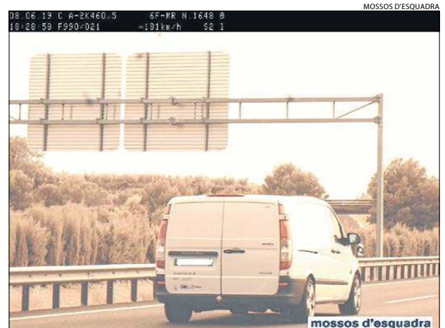
El radar captó la furgoneta circulando a 181 km/h.

Finalmente, el fugitivo sufrió una salida de vía a la altura del punto kilométrico 470 de la autovía, en el término municipal de Els Alamús. A continuación, los agentes comprobaron que el conductor, que fue detenido y estaba ileso, presentaba claros síntomas de encontrarse bajo los efectos de las drogas o del alcohol. En la prueba de drogas dio positivo en consumo de cocaína y THC (cánnabis). Además, no disponía de permiso de conducir por pérdida de los puntos y lo tenía suspendido judicialmente. El domingo pasó a disposición del juez, que decretó su ingreso en prisión.