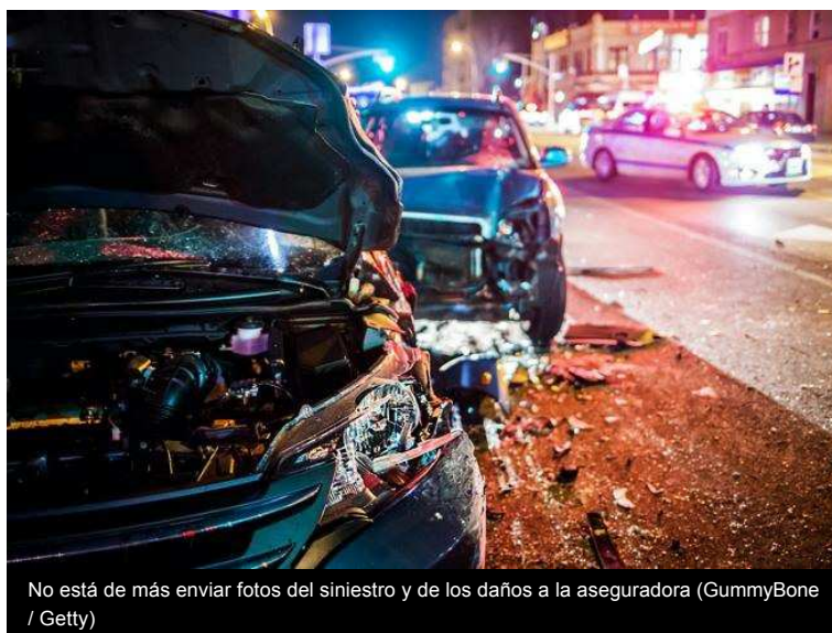
No está de más enviar fotos del siniestro y de los daños a la aseguradora

Si por el contrario las dos partes se ponen de acuerdo, tienes que saber que cuanto más información recopiléis, mejor. También es importante escribir con letra clara y en mayúsculas, facilitará la comprensión.