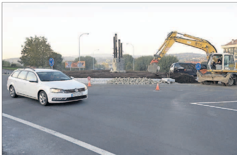
La rotonda de O Montserrat se remató a finales del pasado año.

■ Rotonda de Donramiro. La glorieta que une la calle Ramón Aller con la parroquia de Donramiro, a la altura de la Avenida Cuña, es uno de los nueve puntos negros detectados por el estudio municipal,