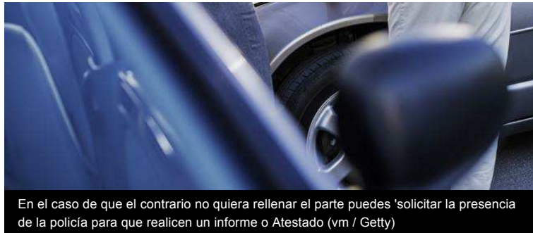
En el caso de que el contrario no quiera rellenar el parte puedes 'solicitar la presencia de la policía para que realicen un informe o Atestado

La mayoría de las compañías aseguradoras entregan a sus clientes varias copias de este documento. No obstante, también puede descargarse a través de internet o utilizar la versión para smartphones disponibles en los markets de Android y App Store. En cualquier caso, siempre es recomendable llevar en el vehículo el documento porqué es la manera más sencilla de reflejar lo sucedido y trasladarlo a las aseguradoras.