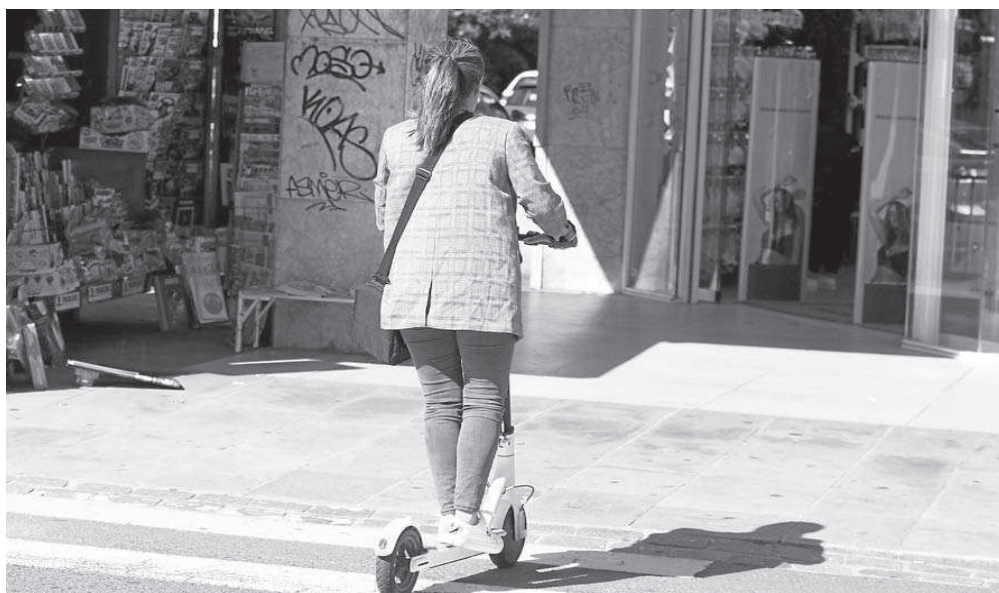
Una usuaria cruza un paso de cebra en patinete eléctrico

"Existe un vacío legal. El Reglamento General de Circulación no contempla el patinete eléctrico y el Ayuntamiento no lo incluirá en las ordenanzas hasta que lo haga la DGT", explica un policía local. No es la primera vez que el conductor de un patinete resulta herido en un accidente de tráfico. Normalmente se produce cuando invaden la calzada, ya sea actuando como vehículo como peatón, atravesando un paso de cebra. Por el momento, siempre se ha saldado con heridas leves para el conductor del patinete, sin mayores consecuencias.