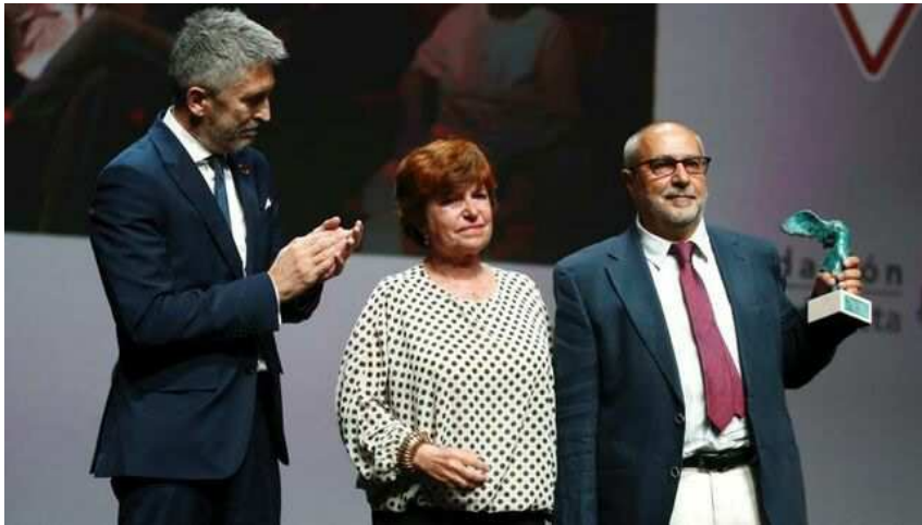
Marlaska recuerda que la responsabilidad de la seguridad vial es de todos

El ministro del Interior en funciones, Fernando Grande Marlaska, ha recordado hoy que la responsabilidad de la seguridad vial es compartida y no solo está en manos de la administración, que "no hace dejación de sus funciones", sino de toda la sociedad.