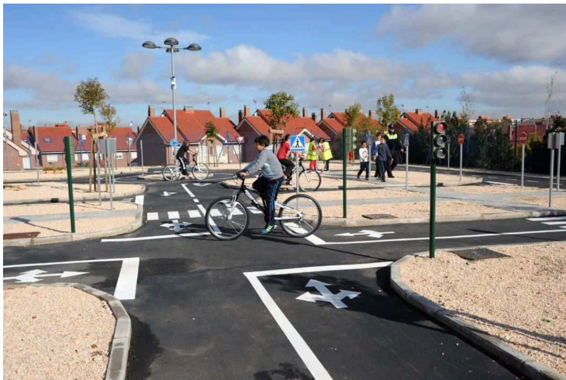
Fuenlabrada Parque Seguridad Vial