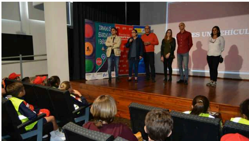
Un momento de las jornadas.

La Consejería de Emergencias y Participación del Cabildo de La Palma y el Ayuntamiento de Los Llanos de Aridane celebran conjuntamente las II Jornadas de Seguridad Vial en esta localidad con tres días en los que se desarrollarán diversas actividades para fomentar los buenos hábitos como peatones y conductores entre los estudiantes del municipio.