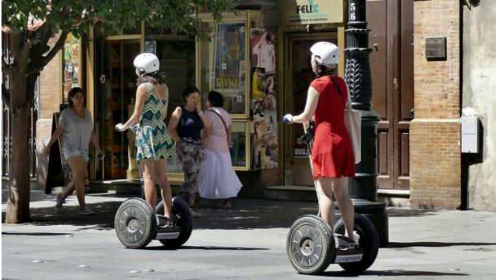
Varias usuarias de segways, por la Avenida -

El Ayuntamiento de Sevilla ha presentado este lunes su proyecto para regular los vehículos de movilidad personal (patinetes, monociclos, hoverboards o segways ), que servirá para modificar la actual ordenanza de circulación, que ha quedado obsoleta en ese apartado a consecuencia de los enormes cambios tecnológicos y el crecimiento consiguiente en el sector. Esto también ha provocado importantes problemas de convivencia con ciclistas y peatones, además de un mayor peligro por la potencia de estos nuevos vehículos unipersonales y su escasa regulación. La junta de gobierno local ha aprobado la modificación de la ordenanza , un documento que ahora será elevado al pleno para su aprobación inicial que se ha diseñado tras un proceso de participación en el que se han tenido en cuenta aportaciones de distintas entidades y colectivos, así como de los ciudadanos a través de la plataforma Decide Sevilla con más de un centenar de propuestas.