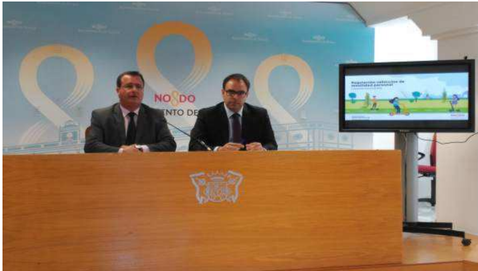
Sevilla.-La nueva ordenanza fija requisitos para patinete eléctrico en carril bi