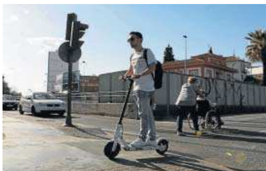
Sobre un patinete eléctrico por Bueno Monreal.