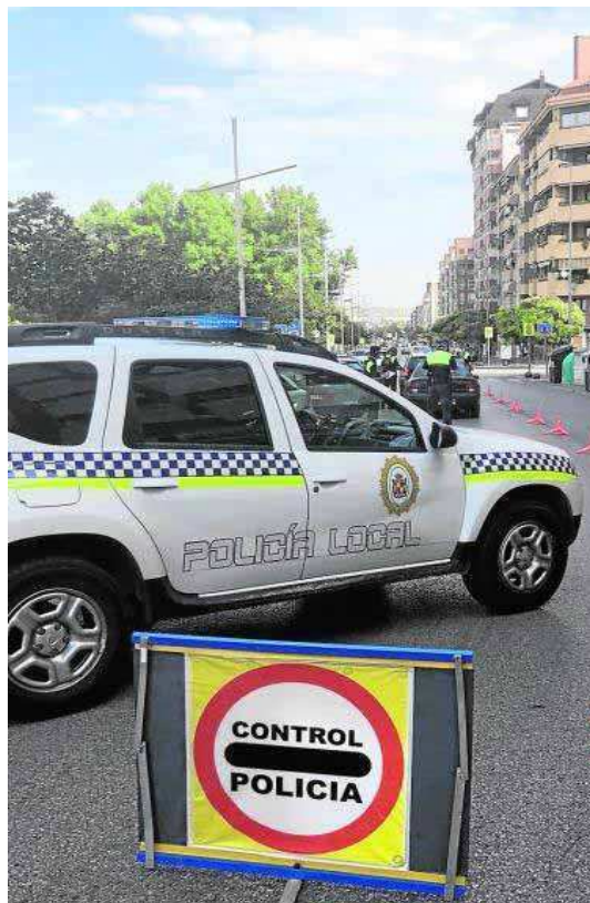
Control de la Policía Local en el Bulevar.

«Era un compromiso del equipo de gobierno el reforzar en materia de recursos humanos el Cuerpo de la Policía Local, y además esta convocatoria ha venido auspiciada por ese adelanto de la edad de jubilación de los policías locales, algo que ha propiciado que se queden plazas vacantes y por lo tanto tengamos la posibilidad de cubrir las al contar con presupuesto para hacerlo», dijo.