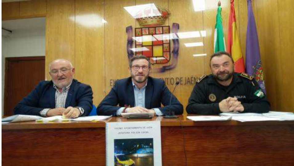
Jaén.- Las rotondas copan los puntos negros de mayor siniestralidad en cuanto a