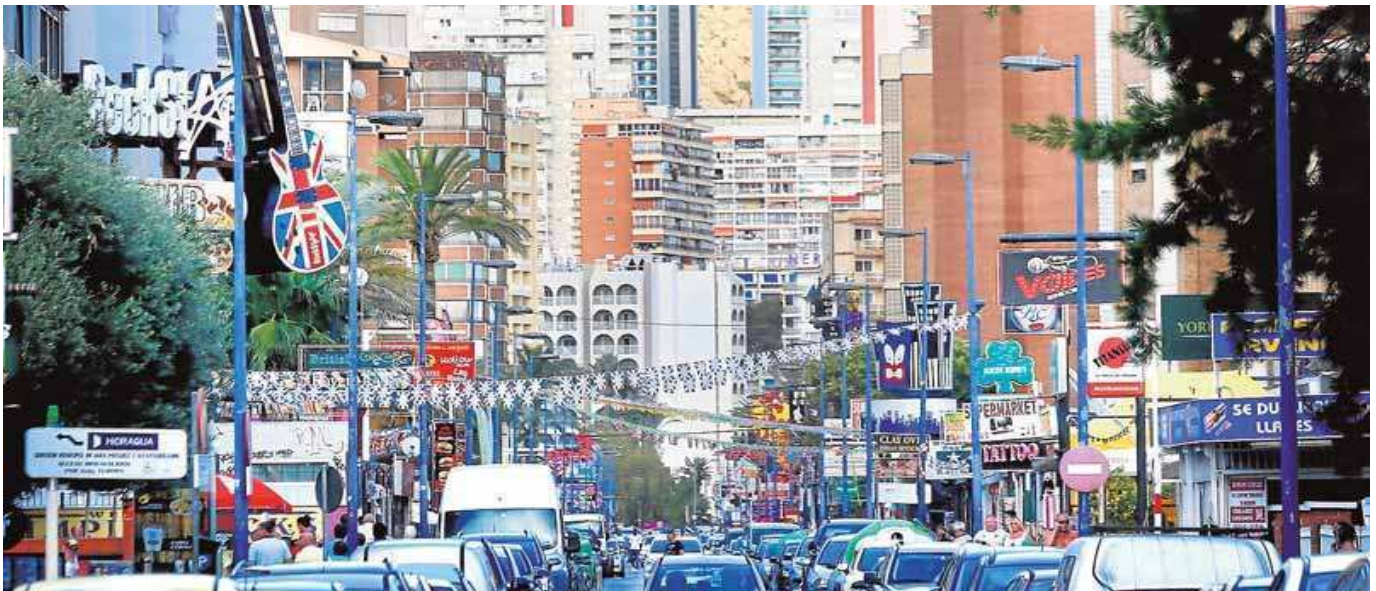
Vista general de una de las calles de la zona 'británica' de Benidorm.