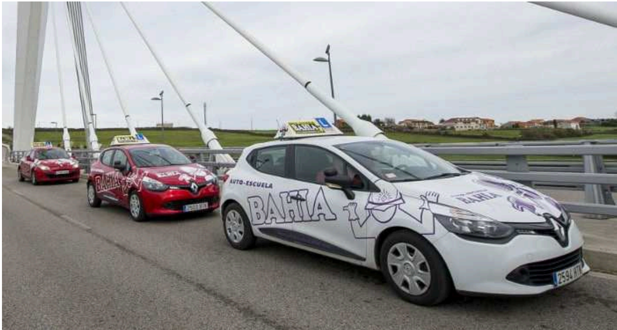
Las autoescuelas reclaman servicios mínimos del 77%

autoescuelas reclaman servicios minimos 77 paros