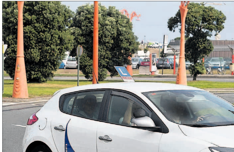
Un coche de autoescuela durante una clase práctica en A Coruña.