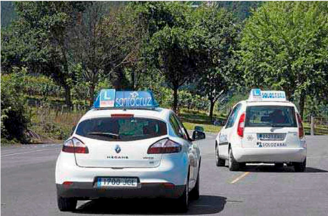
Dos coches de autoescuelas salen de la pista de examen de Olaberria este verano.