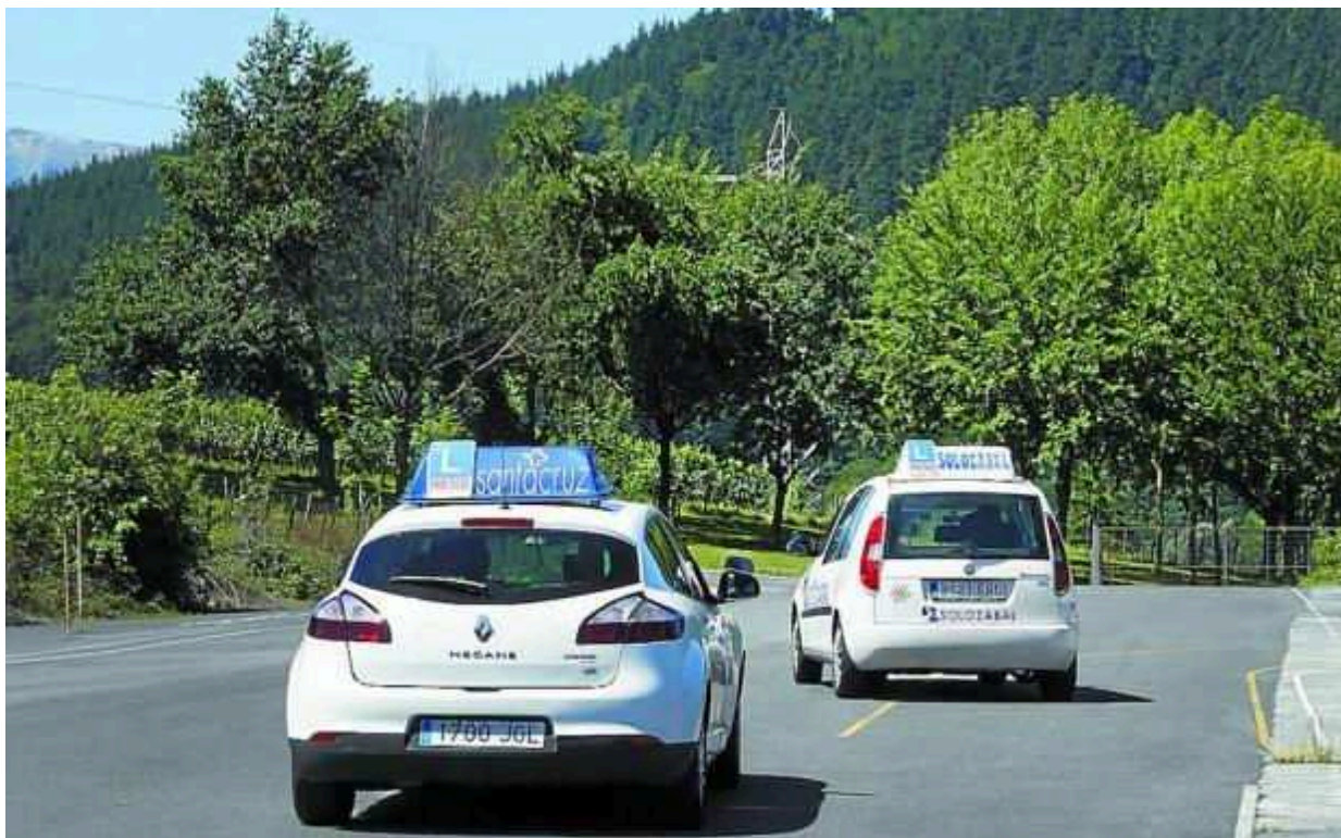
Dos coches de autoescuelas salen de la pista de examen de Olaberria este verano.